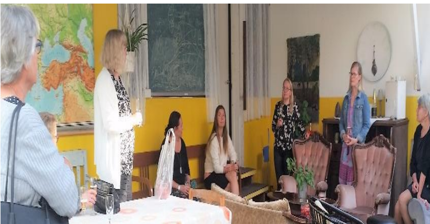
Kylien kesätreffeillä Vähikkälässä tutustuttiin Suvipuotiin, sen kesäolohuoneeseen sekä monipuoliseen toimintaan Vähikkälän seuratalolla.

Vähikkälälle kunniaa valtakunnallisesti Vähikkälän Väjämä -kyläyhdistys palkittiin valtakunnallisessa Älykäs Kylä - sekä Vuoden Kylä 2020 -kilpailussa kunniamaininnalla.