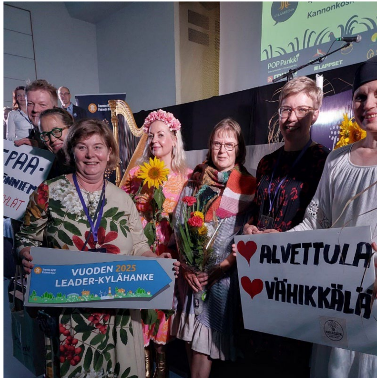
Kuva: Polku kylään -hanke sai valtakunnallisen tunnustuksen Vuoden 2025 Leader-kylähanke. Kyläareenassa olivat mukana hankkeessa asumiskokeiluja järjestäneet kylät.